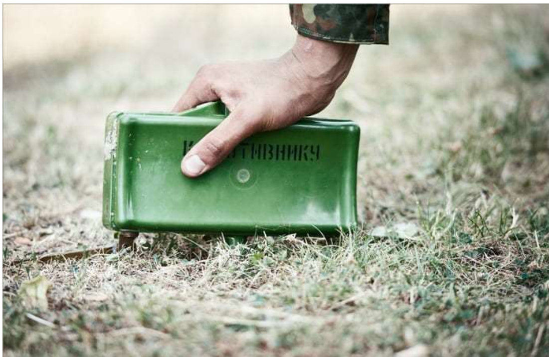
Мина в боевом положении