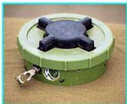
Рис.1 Общий вид мины ПМН-2

ПМН-2 Противопехотная мина нажимного типа